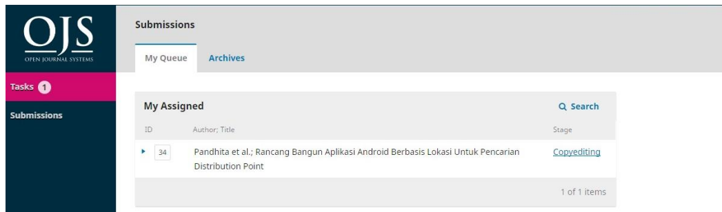
Gambar 1. Tampilan halaman copyeditor