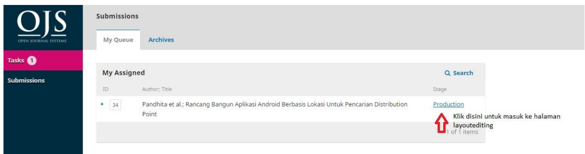
Gambar 1. Tampilan penugasan layout editor