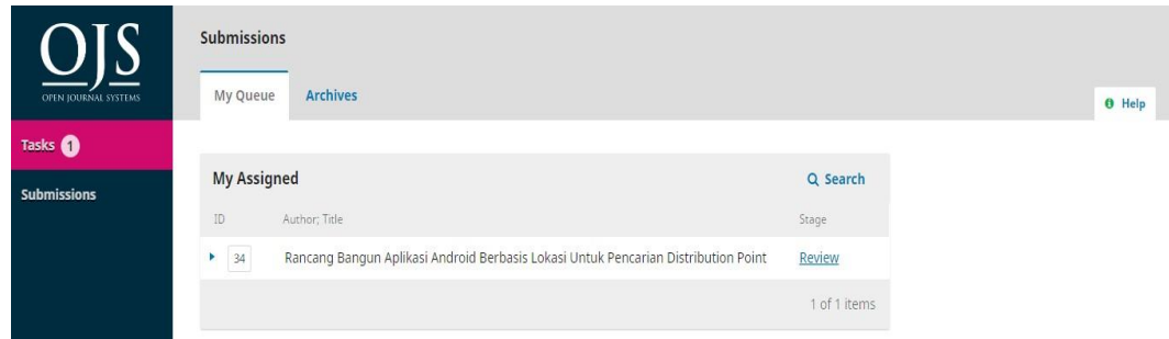
Gambar 1. Tampilan halaman reviewer