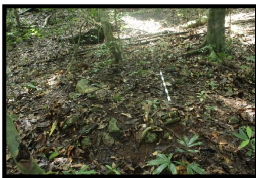
Gambar 6 Makam III

Makam III terletak pada bagian selatan Benteng Bone-Bone yang berdekatan dengan dinding benteng tersebut. Makam III memiliki bentuk yang sama dengan makam II, makam III tidak memiliki jirat hanya terdapat beberapa tumpukan batuan batuan yang diletakan secara tidak beraturan. Pada bagian atas makam III terdapat tumbuhan pohon (lihat gambar 6) dan beberapa tumbuhan semak belukar yang menutupi sebagian besar bada makam tesebut.