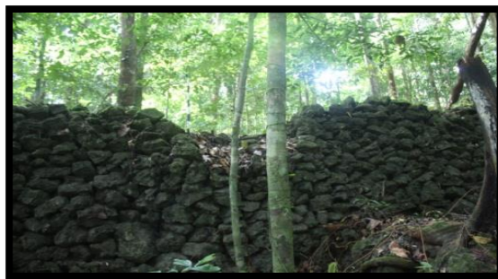
Gambar 1 Dinding Benteng Bone-Bone

Pembuatan dan pembagunan Benteng Bone-Bone dilakukan oleh pasukan Sultan Himayatuddin Muhammad Saidi dengan dibantu oleh masyarakat sekitar. Untuk tahun pembuatan benteng itu sendiri belum diketahui dikarenakan penduduk pada masa itu masih belum mengenal sistem penanggalan masehi sehingga tidak berani untuk mentakan tahun berapa benteng tersebut dibangun namun dapat diketahui secara pasti bahwa Benteng Bone-Bone dibangun pada masa pemerintahan Sultan Himayatuddin Muhammad Saidi pada tahun 1752-1755 dan tahun 1760-1763.