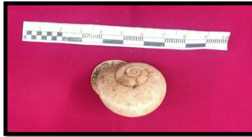
Gambar 7 Fragmen Moluska Helix Potamia