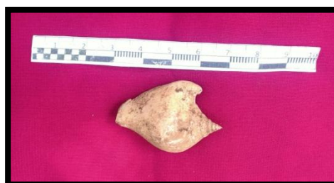
Gambar 9 Fragmen Moluska Pugilina Cochlidium

Fragmen moluska yang ditemukan selanjutnya adalah merupakan fragmen moluska yang berjenis gastropoda dengan nama latin pugilina cochlidium Fragmen moluska tersebut ditemukan pada bagian dalam Benteng Bone-Bone yang berdekatan dengan dinding pada bagian selatan benteng tersebut dengan memiliki warna putih pada maluska. Jenis moluska pugilina cochlidium sering ditemukan pada pesisir pantai didalam hutan bakau.