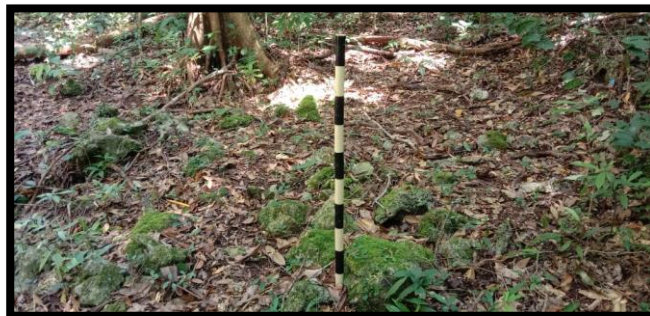
Gambar 5 Makam II

Makam II terletak pada bagian dalam Benteng Bone-Bone yang terletak berdekatan dengan makam I atau tepat berada pada bagian tengah Benteng Bone-Bone. Makam II tidak memiliki jirat hanya terdapat beberapa material batuan yang ditumpuk secara tidak beraturan, pada bagian atas makam terdapat tumbuhan pohon (lihat gambar 5) yang menyebabkan akan tumbuhan tersebut sebagian besar badan makam sehingga hampir tidak bisa dilakukan identifikasi.