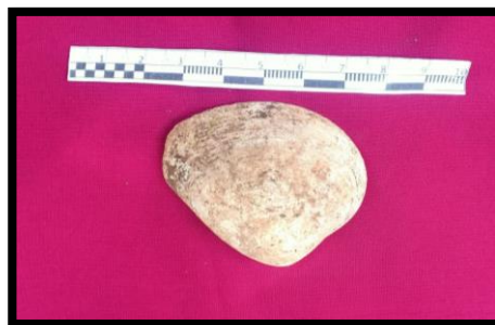
Gambar 8 Fragmen Moluska Ruditapes Decussatus

Fragmen moluska yang ditemukan selanjutnya adalah merupakan fragmen moluska yang berjenis kerang dengan nama latin ruditapes decussatus . fragmen moluska tersebut ditemukan berdekatan dengan fragmen moluska sebelumnya yang terletak tidak pada dinding Benteng Bone-Bone. Jenis moluska ruditapes decussatus sering ditemukan pada permukaan bibir pantai dan pada pesisir sungai yang memiliki kandungan air payau. Fragmen moluska yang ditemukan pada benteng tersebut memiliki warna putih dengan ukuran panjang 4 cm.