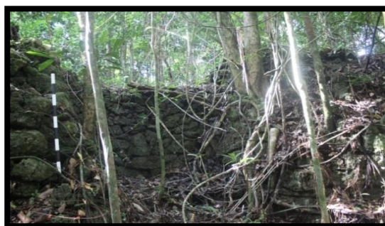
Gambar 3 Lawa II Benteng Bone-Bone

Lawa II terletak pada bagian barat Benteng Bone-Bone dengan orientasi arah hadap 206°. Lawa II merupakan pintu masuk kedua untuk masuk dalam benteng yang secara keseluruhan material yang digunakan dalam lawa II menggunakan material batuan dan memiliki lebar 2,80 meter. Berdasarkan hasil pengamatan kondisi lawa II tidak jauh berbeda dengan kondisi lawa I, pada lawa II terdapat beberapa kerusakan (lihat gambar 3) pada susunan konstruksi batuan dinding benteng.