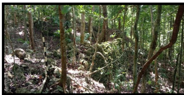
Gambar 2 Lawa I Benteng Bone-Bone

Lawa I terletak pada bagian selatan Benteng Bone-Bone dengan orientasi arah hadap 173^{\circ} . Lawa I menjadi akses utama atau pintu masuk utama untuk menuju dalam benteng tersebut. Lawa I seluruhnya terdiri susunan material batuan yang memiliki ukuran lebar 2,75 meter. Berdasarkan hasil pengamatan kondisi Lawa I sudah mengalami kerusakan terutama pada konstruksi dinding benteng (lihat gambar 2) namun hal tersebut tidak memberikan pengaruh yang berarti pada bentuk lawa tersebut.