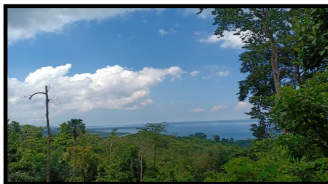
Gambar 11 Pemandangan dari Atas Benteng Bone-Bone

Pembangunan Benteng Bone-Bone yang diperkuat dengan ketebalan dinding berukuran 1,50 meter pada bagian bawah dan 94 cm pada bagian dinding atas tentunya tidak serta merta dibangun sebagai tempat peristirahan namun untuk mempertahankan sebuah wilayah dari gempuran musuh yang datang dari luar. Selain ketebalan dinding, bangunan Benteng Bone-Bone juga didukung wilayah benteng tersebut dibangun. Benteng Bone-Bone dibangun pada sebuah perbukitan dengan ketinggian 450 meter di atas permukaan laut (lihat gambar 11) sehingga sangat memungkinkan pada benteng tersebut dilakukan pengintaian dan pengawasan pergerakan musuh dan sangat efektif untuk dilakukan sebuah serangan kepada musuh yang langsung menuju kepada target serangan.