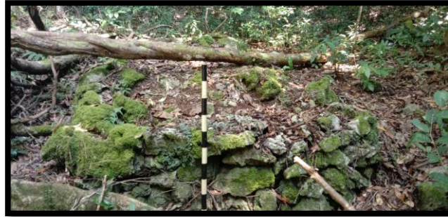
Gambar 4 Makam I

Gambar 4 menunjukkan kondisi makam I yang telah mengalami kerusakan pada jirat makam akibat tertimpa pohon yang telah tumbang, pada jirat makam juga banyak terdapat tumbuhan lumut yang hampir menutupi jirat makam I. Makam I memiliki ukuran panjang 3,20 meter, lebar 1,70 meter dan tinggi jirat makam 53 cm serta lebar jirat 37 cm.